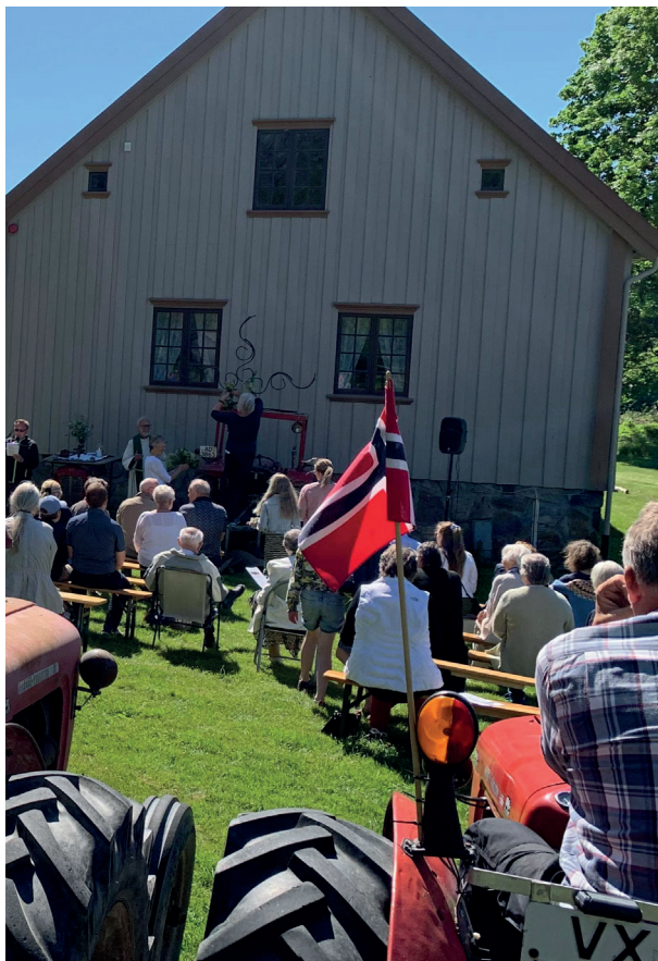
TRAKTORBUE: Selve gudstjenesten foregikk utendørs.