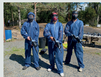
GODT BESKYTTET: På Våler aktivitetssenter var det paintball-kamp for konfirmantene.

Nytt i år var at vi dro en dag til Våler aktivitetssenter der vi hadde en full dag med klatring,