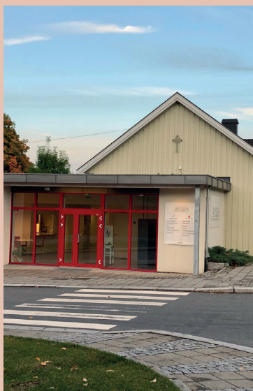
VARIERT: Møteplass Mysen menighet har variert program i høst.