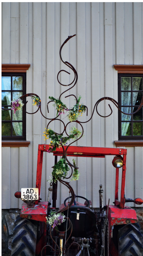
PROSESJONSKORS: Leif Larsen har smidd det fine korset av harvetinder. Korset pyntes av barna som har plukket nydelige markblomster.