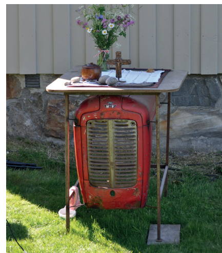
ALTER: Et panser fra en Massey Ferguson tjener som alter under traktorgudstjenesten.

Entusiasmen og gløden som ble vist fra stolte veterantraktoreiere viser hvor stor interessen er for gamle ting og spesielt for veterantraktorer i Trøgstad samfunnet.