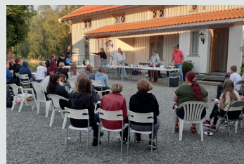
SAMLING: Konfirmantene hadde samling ved Askim prestegård.

zip-line, rodeo og paintball. Alt dette til stor begeistring for både konfirmanter og ledere. Det ble til sammen noen lange og intense dager, men de var også vellykkede takket være en sporty stab, gode frivillige, en herlig konfirmantgjeng og strålende vær. ■