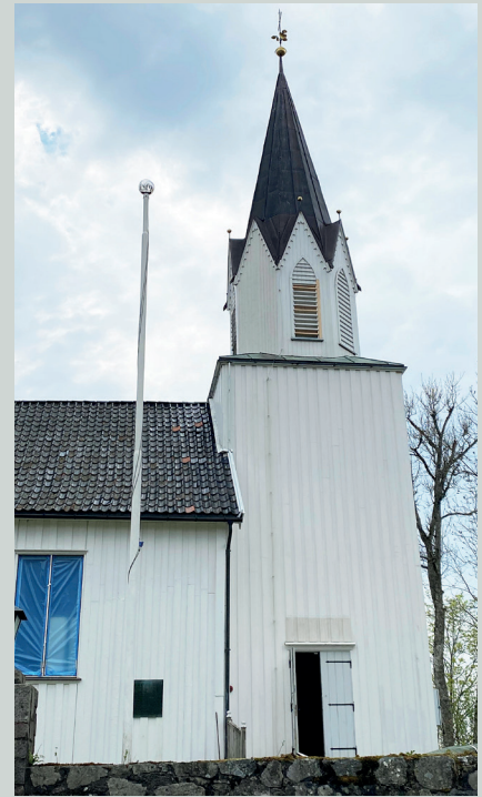
FERDIG UTENPÅ: Tomter kirke erferdig renovert utenpå; her skal det gjøres arbeider innendørs utover høsten.

Kirken er kompleks, og det tar tid å gjennomføre endringer. Noe kan bli bestemt i 2022 eller 2023, men det vil ta tre-fire år å få implementert det som vedtas som ny kirkeordning. ■