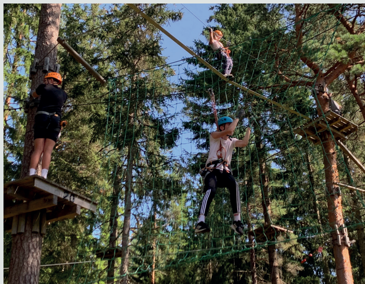
HØYT: Konfirmantene i Askim fikk prøve seg i en klatreløype i Våler.